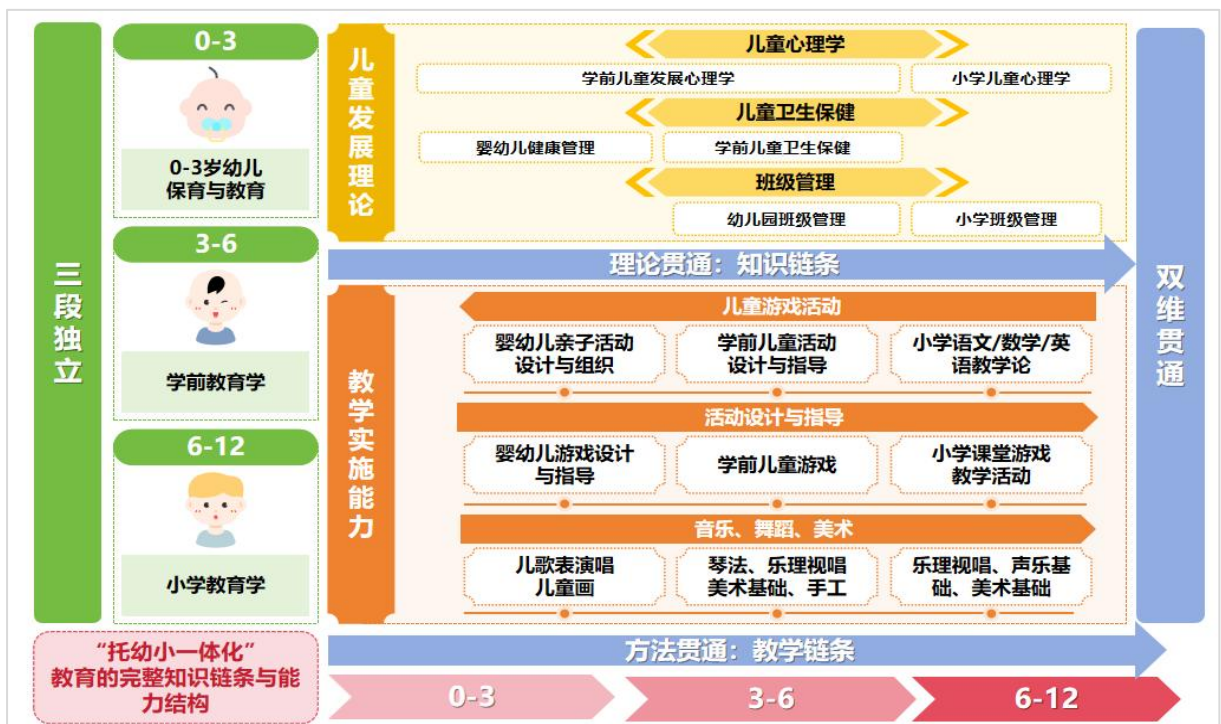
图3 三段独立-双维贯通式课程体系

一是重构课程模块，打通课程壁垒。设计覆盖0-12岁儿童教育的三段独立-双维贯通式课程体系，纵向维度精准对应托、幼、小三个学段，设置“三段独立”的专业课程，横向维度打破理论与方法壁垒，在通用课程中融入分阶模块。（见图3）