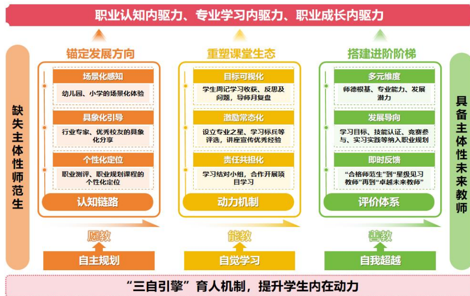
图2 “三自筑基”育人机制

一是以“自主规划”锚定发展方向，构建“场景化感知+具象化引导+个性化定位”的认知链路，通过学期初开展赴园赴校感知核心职业场景、学期中专家校友具象化分享经验、学期末针对性职业测评定位，指导2123名学生制定职业规划。二是以“自觉学习”重塑课堂生态，建立“目标可视化+激励常态化+责任共担化”的动力机制：12门专业核心课程课前制定可视化学习目标，课中组建学习互助小组，课后设立榜样宣传经验。三是以“自我超越”搭建进阶阶梯，通过“多元维度+发展导向+即时反馈”评价体系完善阶梯式认证标准，对1236名学生进行从合格师范生到卓越未来教师的认证。