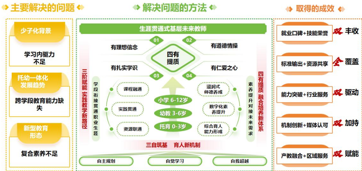
图1 成果主要内容与逻辑关系