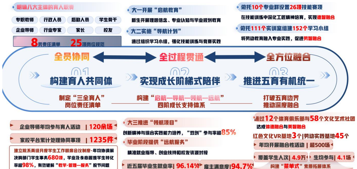
图3 重塑“三个维度”实现路径图

(1) 全员协同，打造育人共同体。明确专职教师、行政人员、后勤人员、学生骨干及企业导师、行业专家、家长、校友等 8大主体 的育人职责，形成 8类 责任清单和 25项 岗位规范。