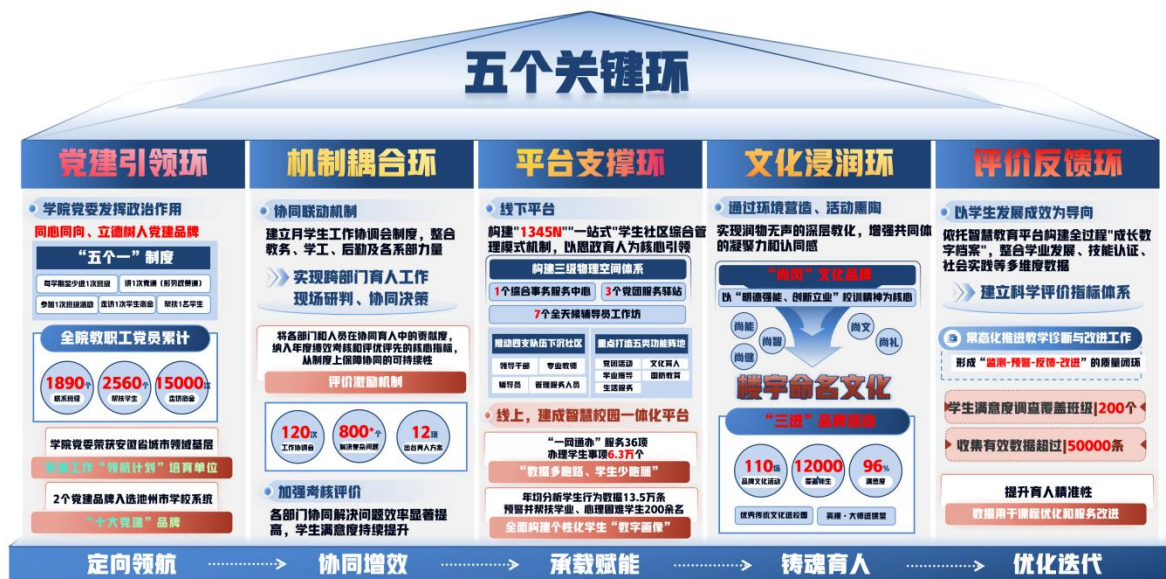
图 5 “五个关键环”实现路径图

重点打造党团活动、文化育人、学业指导、国防教育、生活服务 5 类功能阵地，集成心理健康、职业规划、创新创业、困难帮扶等 N 项精准服务项目，构建全方位、多层次的育人服务体系。线上建成智慧校园平台，实现 136 项服务“一网通办”，累计办理事项 6.3 万件，通过数据分析构建学生数字画像，精准帮扶困难学生 2000 余名。