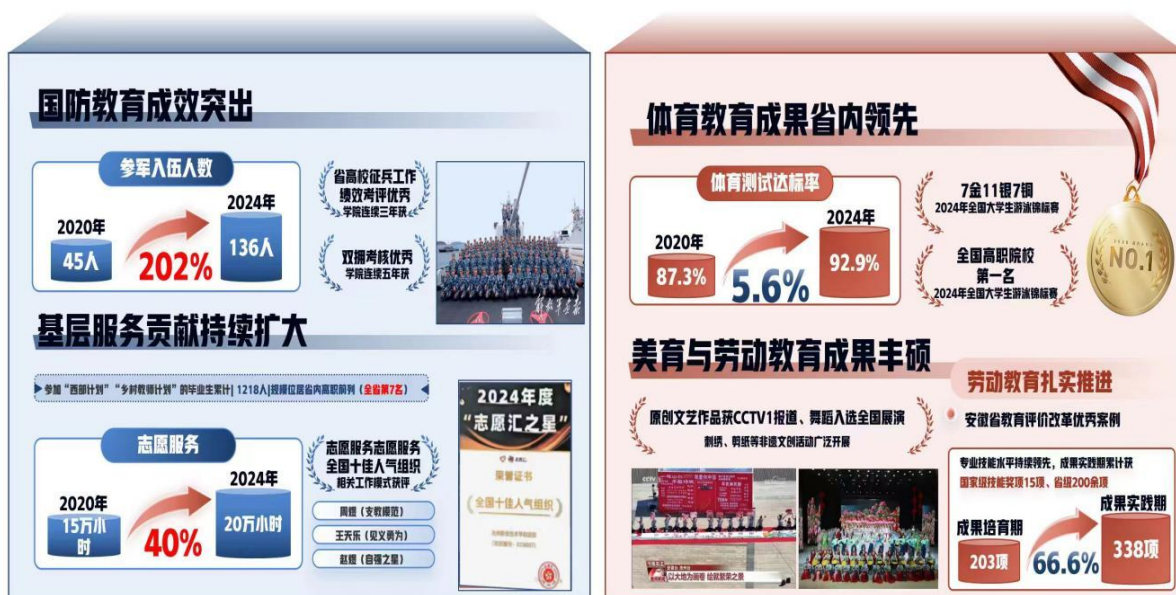
图 6 人才输出质持续优化

规模位居省内高职前列。志愿服务年均突破 20 万小时，增长 40%，高质量服务中国农民丰收节等大型活动，相关工作模式获评“ 志愿服务全国十佳人气组织 ”，涌现出周煜、王天乐、赵煜等优秀毕业生。