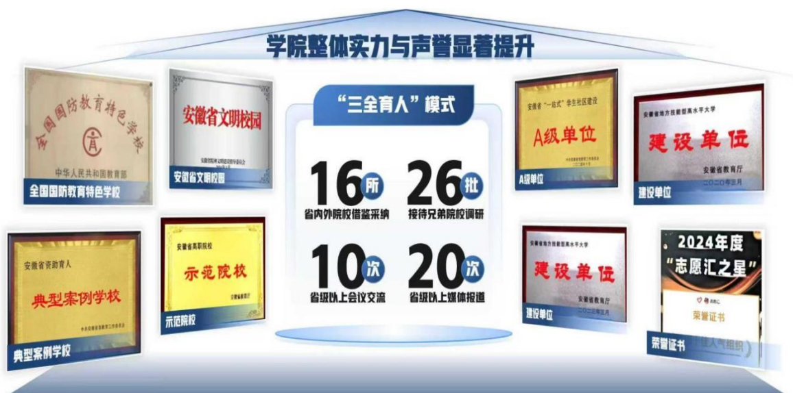
图 7 改革成果卓著，获得各方广泛好评

（三）改革成果实现“校内-校外”双向辐射，示范效应持续扩大。学院入选省“双高计划”学校及技能型高水平大学建设单位。“三全育人”模式被 10 余所省内外院校借鉴采纳，接待 26 批次兄弟院校调研，相关成果在省级以上会议交流 11 次，发表论文 20 篇。“1345N”一站式学生社区建设获评省级 A 级单位（省内高职排名第 5）。育人典型经验在中国网、全国高校思政网等宣传报道，李和平、赵振华等领导来校考察予以高度评价。先后获得全国国防教育特色学校、全国五四红旗团委、志愿服务全国十佳人气组织、安徽省文明校园、省级资助育人典型案例学校、省级校企合作示范校等。