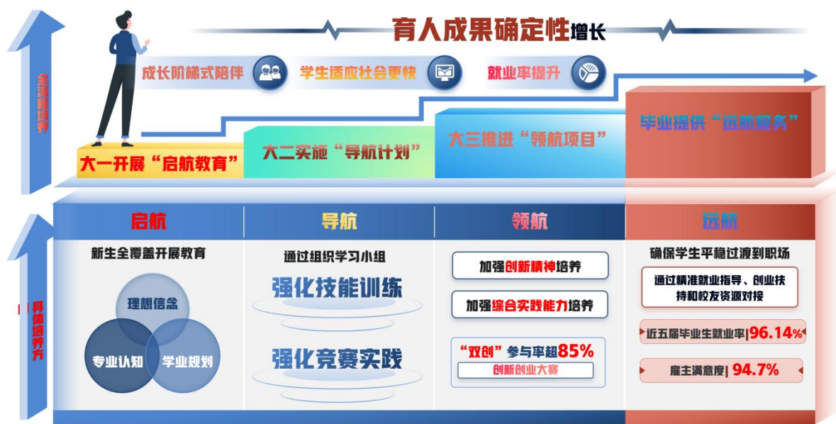
图4 四阶成长支持体系实现路径图

(2) 全过程贯通，实现成长阶梯式陪伴。构建“ 启航—导航—领航—远航 ”四阶成长支持体系。 大一 开展“启航教育”，新生全覆盖开展理想信念、专业认知与学业规划教育，学生年人均参与志愿服务时长超过22小时； 大二 实施“导航计划”，通过组织学习小组，强化技能训练与竞赛实践，人均参加技能大赛或学习小组不少于1项； 大三 推进“领航项目”，加强创新精神与综合实践能力培养，“双创”参与率超85%； 毕业 阶段提供“远航服务”，通过精准就业指导、创业扶持和校友资源对接，确保平稳过渡到职场。近五届毕业生就业率96.14%，雇主满意度94.7%。